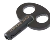
Afb. 4: CERAMO ® -inbussleutel NVG-9